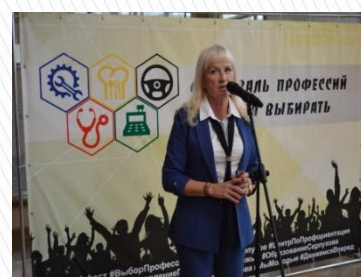
МБУ центр по профориентации и трудоустройству молодежи г. Серпухов