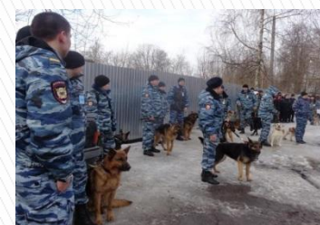
ФКУ СИЗО-3 УФСИН России по Московской области