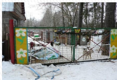
Приют для бездомных собак «Хвостатый рай» г.о. Протвино