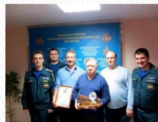
ФГКУ "Специальное управление ФПС №88 МЧС России"