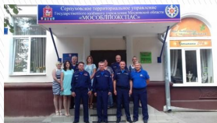
Серпуховское территориальное Управление силами и средствами ГКУ МО "Мособлпожспас"