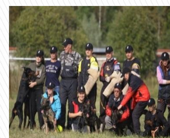
Кинологические клубы и Союз кинологов России

Преподаватели спецдисциплин по специальностям «Кинология», «Защита в чрезвычайных ситуациях»