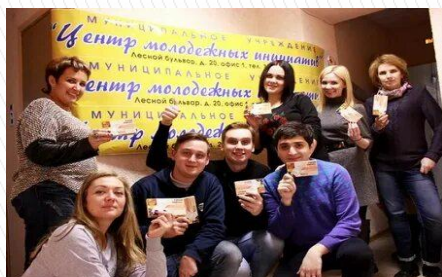
Муниципальное автономное учреждение «Центр молодежных инициатив» г.о. Протвино