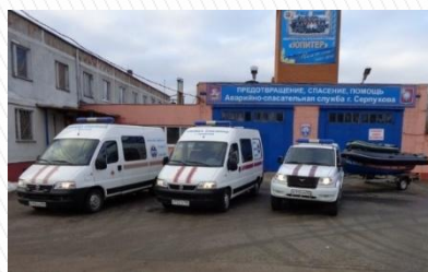
МУ «Аварийно-спасательная служба «Юпитер» Серпухов